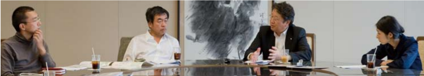
左から藤本壮介氏、隈研吾氏、大栗育夫氏、乾久美子氏。